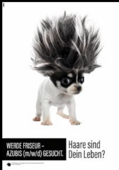
Azubiwerbung Motiv 1 Art.-Nr. SLW-0001