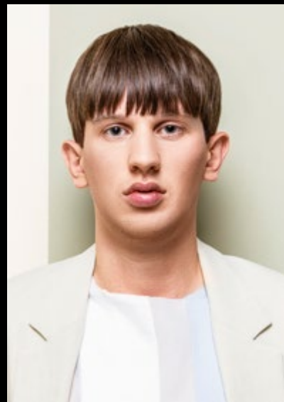
Motiv 3 | Art.-Nr. 1520