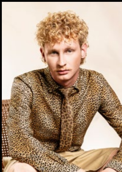
Motiv 2 | Art.-Nr. 1519