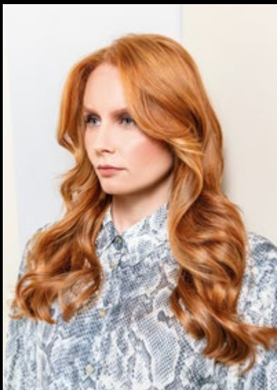
Motiv 1 | Art.-Nr. 1518