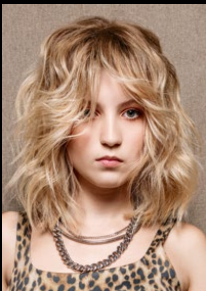
Motiv 5 | Art.-Nr. 1522