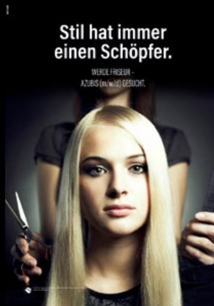
Azubiwerbung Motiv 2 Art.-Nr. SLW-0002