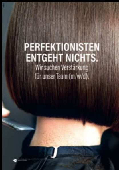
Mitarbeiterwerbung Motiv 3 Art.-Nr. SLW-0003

Mit Social-Media-Posts für Instagram und Facebook und den neuen DIN A1 Postern fallen Sie auf und finden die Mitarbeiter oder Azubis, die zu Ihnen passen.