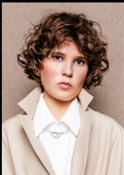
Motiv 6 | Art.-Nr. 1523